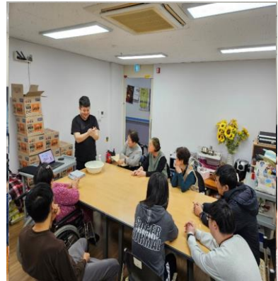
손 씻기 교육