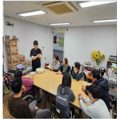
손 씻기 교육