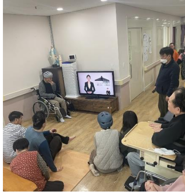
시청각 교육 II